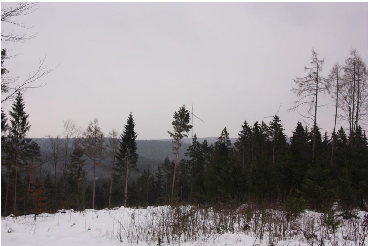
Abbildung 7.3: Blick von FP 2 in Richtung Nordost