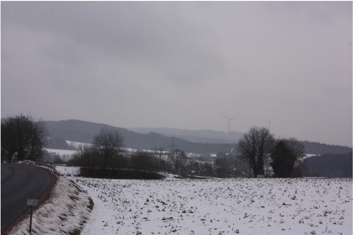
Abbildung 7.2: Blick von FP 1 in Richtung Ost