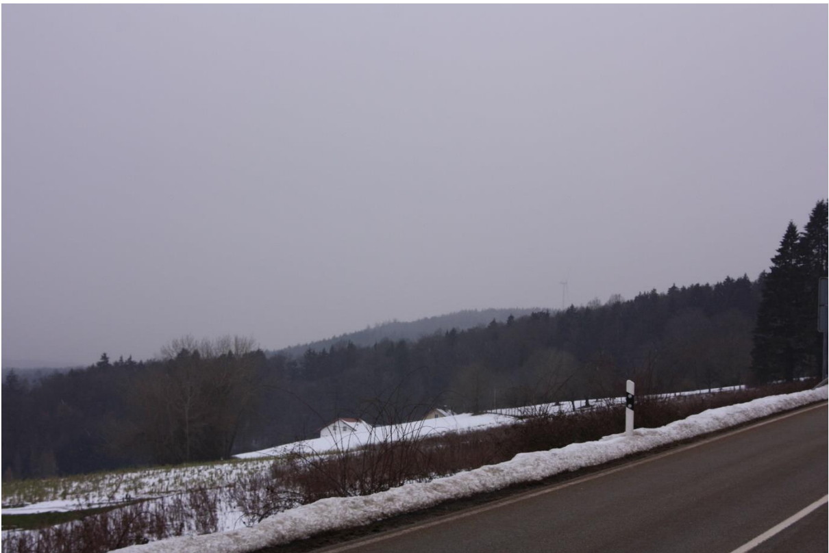
Abbildung 7.5: Blick von FP 4 in Richtung Nordwest