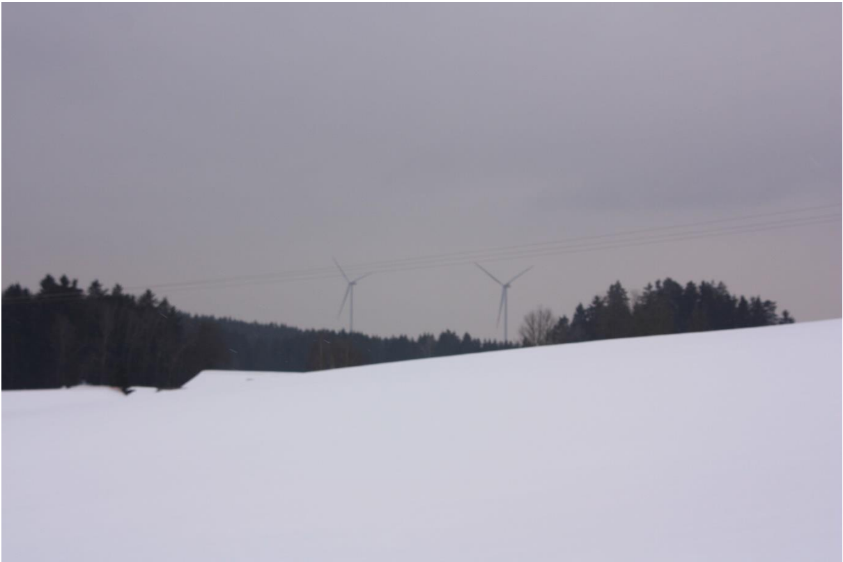
Abbildung 7.4: Blick von FP 3 in Richtung Süd