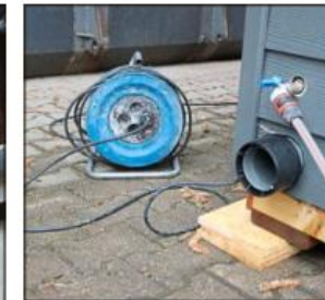
Strom, Wasser, Abwasseranschluss – und schon ist das „WC-Mobil“ einsatzbereit.