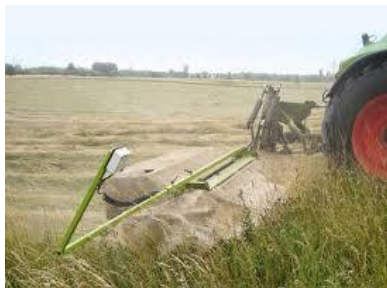
Händler Conrad Electronic Modell Wild rescue kit Wildvertreiber