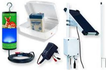
Hersteller NaturTech Oberland Modell KR01 „Komplett“