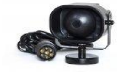
Hersteller LUXKRAFT Modell Hubertus