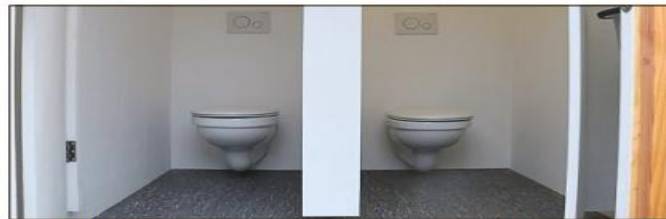
In der Damentoilette gibt es zwei Kabinen und ein Waschbecken.

das „WC-Mobil“ mit Latexfarbe gestrichen – denn die ist abwaschbar. Bei Bedarf kann das gesamte Häuschen nun mit dem Gartenschlauch ausgewaschen werden. Auch eine entsprechende Beleuchtung wurde eingebaut und mit einem FI-Schalter gesichert. Die Sanitäreinrichtungen sind handelsübliche Produkte aus dem Fachhandel.