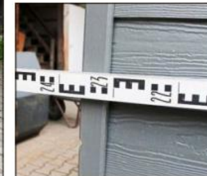
Mit einer Breite von knapp 2,40 Metern kann das „WC-Mobil“ auf einem Anhänger transportiert werden.