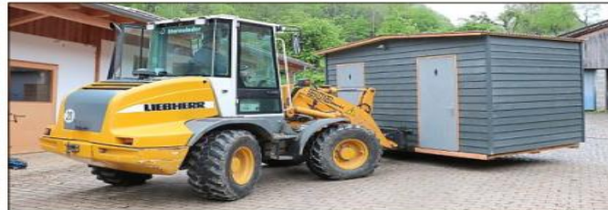
Das „WC-Mobil“ kann über zwei Hohlschienen mit einem Lader verho-ben werden und kommt dadurch ohne eigene Räder aus.

In einem ersten Arbeitsschritt mussten sie aus den Entwürfen handfeste Pläne anfertigen. „Wir haben überlegt, wie wir das einfach und kostengünstig umsetzen können“, erklärt Macht. Für die Grundkonstruktion von Wänden und Dächern wurden Dreischichtplatten gewählt. Die Außenschalung besteht aus witterungsbeständigen Fassadenpaneelen, das Dach ist mit Wellblech verkleidet. Innen wurde